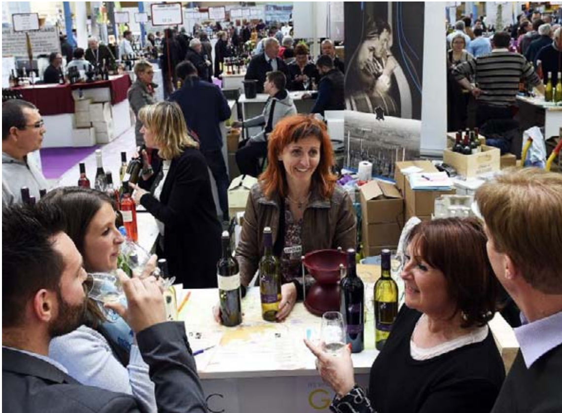
Après « une très bonne fréquentation vendredi et samedi », selon des exposants, l'affluence était un peu moindre dimanche après-midi. La faute au soleil peut-être...

Dimanche, la fréquentation du Salon des vins de terroir et des produits régionaux de Seclin était moindre que les jours précédents. Pas de quoi chagriner les exposants qui semblent avoir déjà bien écoulé leurs stocks. D'autant que le public n'a pas totalement boudé les dégustations hier.