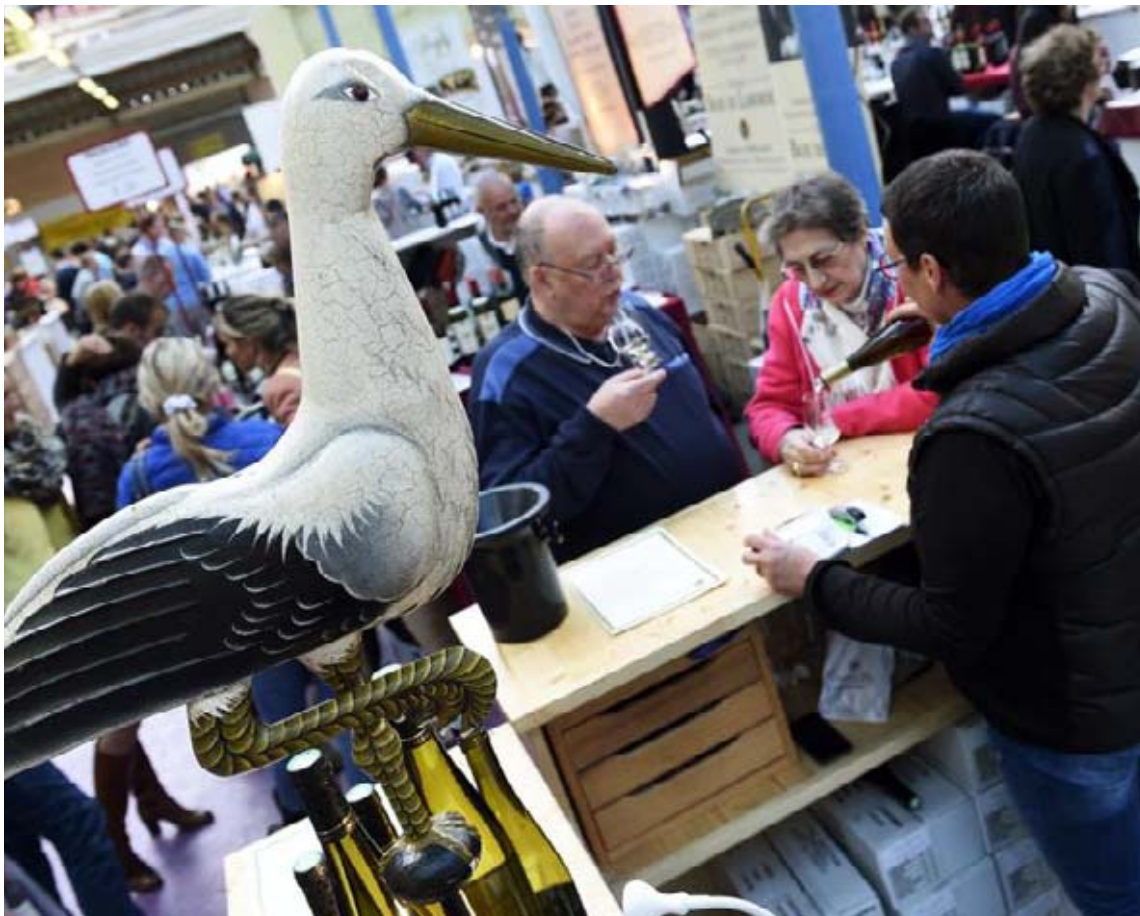
« On est majeur cette année ! ». Au stand de Dominique Freyburger, on a le sourire. Cela fait dix-huit que ces producteurs viennent au Salon des vins, ils ont leur clientèle et ne se soucient guère de la fréquentation.